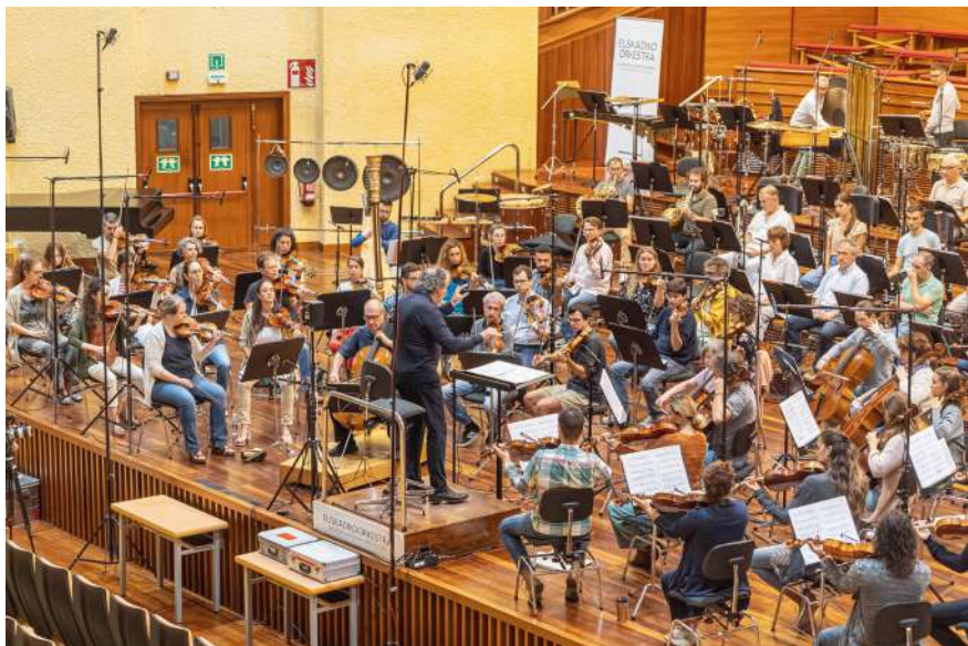
Basque National Orchestra